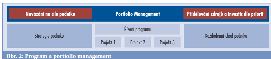
Obr. 2: Program a portfolio management

Průzkum organizovala společnost Ernst & Young se záměrem dát možnost českým firmám a institucím porovnat se mezi sebou navzájem a najít si ve výsledcích informace a náměty, jak své projektové řízení vylepšit. Na www.ey.com/cz najdete zkrácený přehled výsledků tohoto i letošního průzkumu projektového řízení.